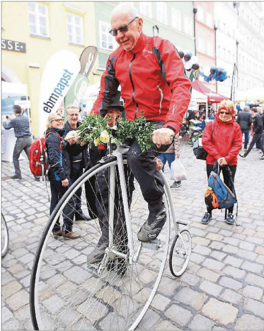
Jeder, der mochte, konnte eine Runde mit dem Hochrad drehen.