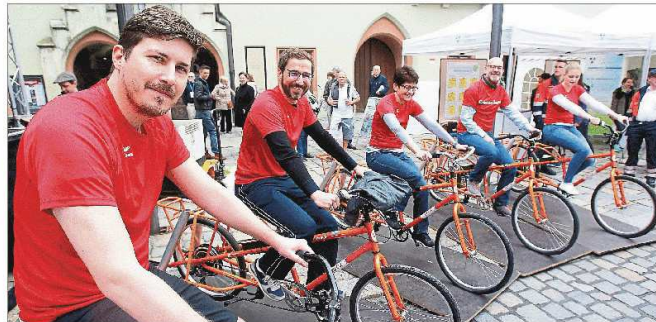
Auch das LZ-Team trat in die Pedale, damit die mit Muskelkraft betriebene Bühne mit umweltfreundlichem Strom versorgt wurde.