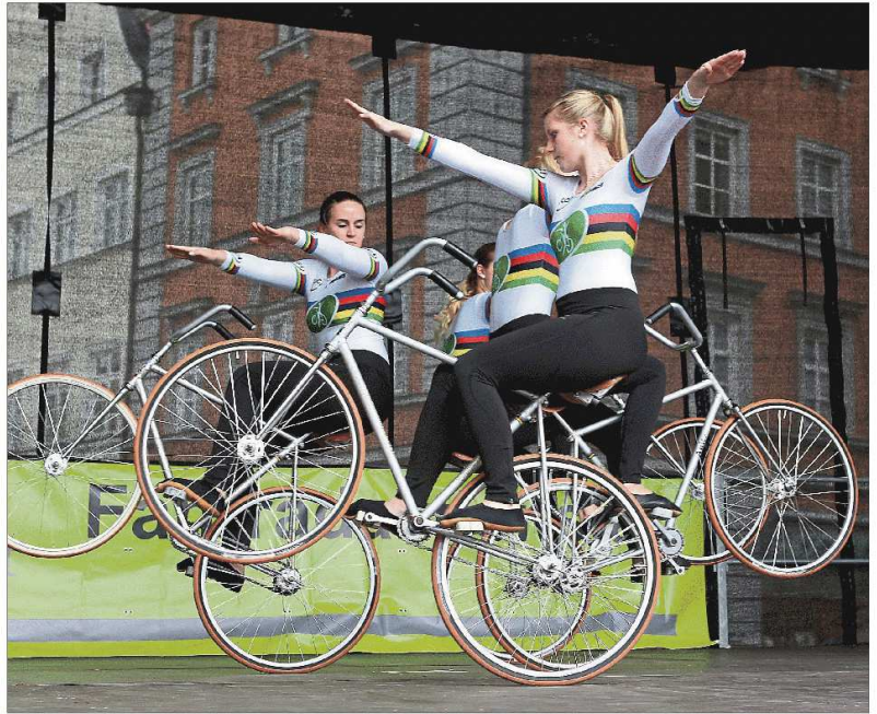
Die Kunstradfahrer zeigten, wie Sport mit dem Fahrrad ganz anders aussehen kann.