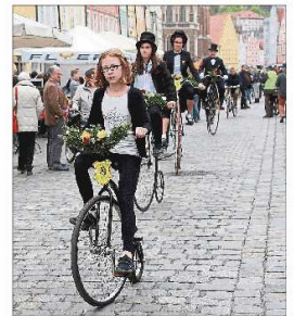
Die Historischen Hochradfahrer zeigten ganz unterschiedliche Modelle.