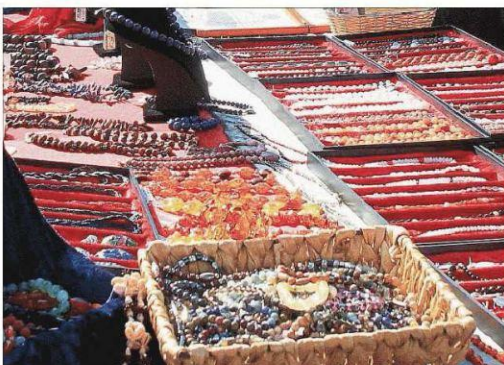
Auf dem Antik- und Trödelmarkt konnte man kleine Schätze finden.