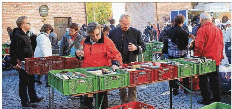
Viele Schmöcker des Stadttheaters wurden am Ländtor zum Verkauf angeboten.