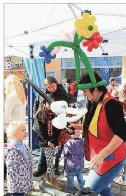
Schwert oder Blume?