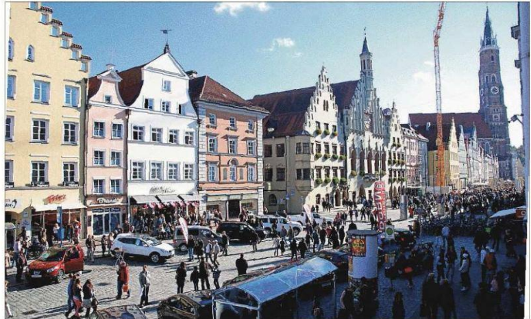
Die Autoschau war dieses Mal in der Altstadt und die Oldtimer-Show in der Neustadt.