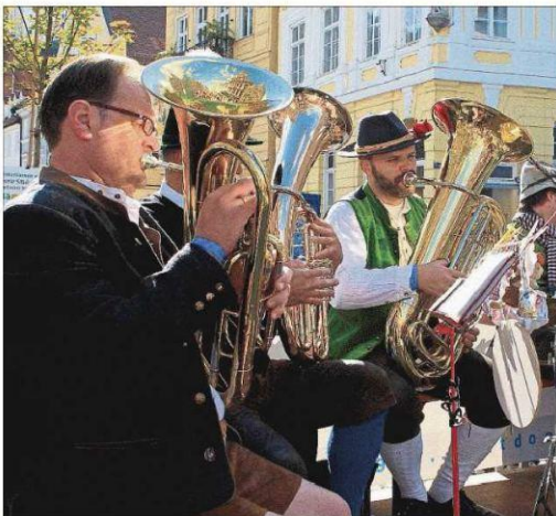
Die Musikanten in der Neustadt sorgten für bayerisches Flair.