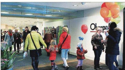
Die Geschäftsinhaber waren mit den Besucherzahlen sehr zufrieden.