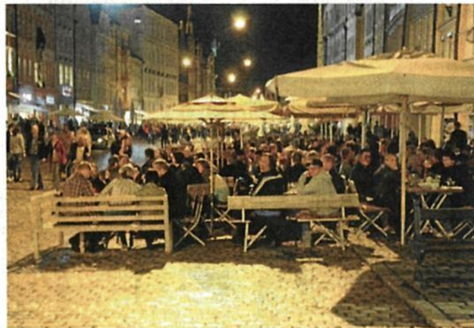
Während der Shoppingpausen laden die zahlreichen Cafés in der Innenstadt zum Verweilen ein.

„Kunst bewegt“ und so ist diese Nacht von den gelben Füßen – inzwischen das untrügliche Erkennungszeichen der Kunstnacht – geführt, auch wieder eine Einladung an alle zum Betrachten, Entdecken, Shoppen, Flanieren und Feiern.